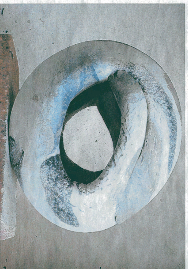
L'exposition « 30 céramistes, trente regards » à partir de 18h30 vendredi.